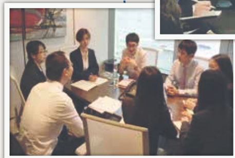
多元化的国际导师团队